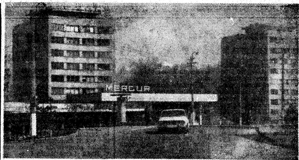
Zona complexului comercial „Mercur” din cartierul Coroești, un loc pitoresc și cu atracție în orașul Vulcan.

În spiritul ideilor și tezelor din cuvîntarea tovarășului NICOLAE CEAUȘESCU rostită cu prilejul aniversării gloriosului jubileu al partidului