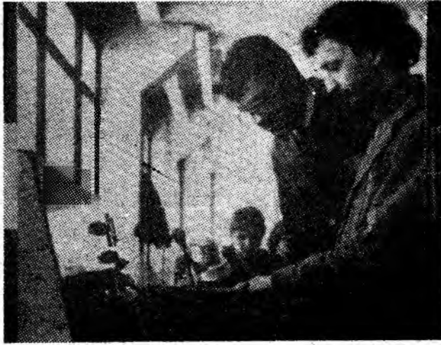
Stand de încercare ACRJ 1 din atelierul de automatizări al I.P.S.R.U.E.E.M. Petroșani.