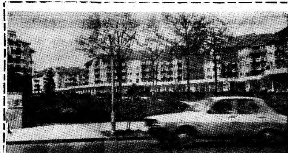
Aspect care vorbește despre amplitudinea procesului de modernizare social-edilitară din cartierul Petrosani-Nord.