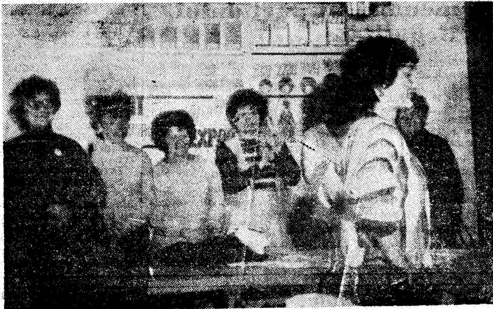
Asistînd la parada modei în cadrul întreprinderii de tricotaje Petroșani.

Sînt acțiuni, inițiative și forme de activitate valoroase, apreciate în unanimitate în cadrul schimbului de experiență. S-a subliniat, totodată, posibilitatea perfecționării și diversificării lor continue, pe măsura menirii și responsabilităților sporite ce revin comitetelor și comisiilor de femei, a contribuției de înaltă răspundere pe care trebuie s-o aducă femeile la îndeplinirea programelor de dezvoltare economico-socială.