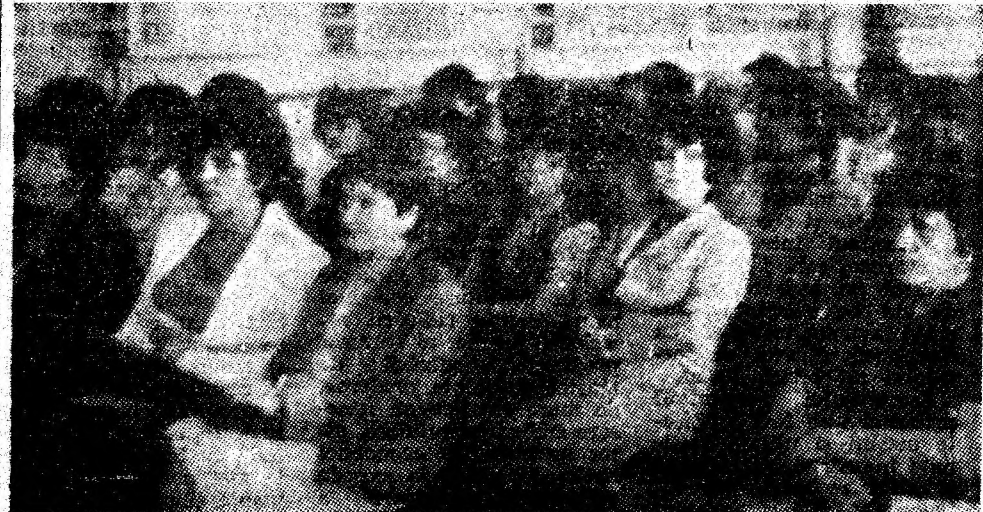
Aspect de la consfătuire.

Avînd un program complex de desfășurare, instruirea a prilejuit un valoros schimb de experiență între participante, relevarea preocupărilor, modalităților de acțiune și rezultatelor obținute de comitetela și comisiile de femei din Valea Jiului, relevate atît cu prilejul vizitelor întreprinse de participante la diferite unități din municipiu, precum și în cadrul consfătuirii cu caracter de schimb de experiență la nivel de municipiu. În cele ce urmează înfățișăm principalele momente ale desfășurării schimbului de experiență, datele și experiența pe care le-a pus în evidență.