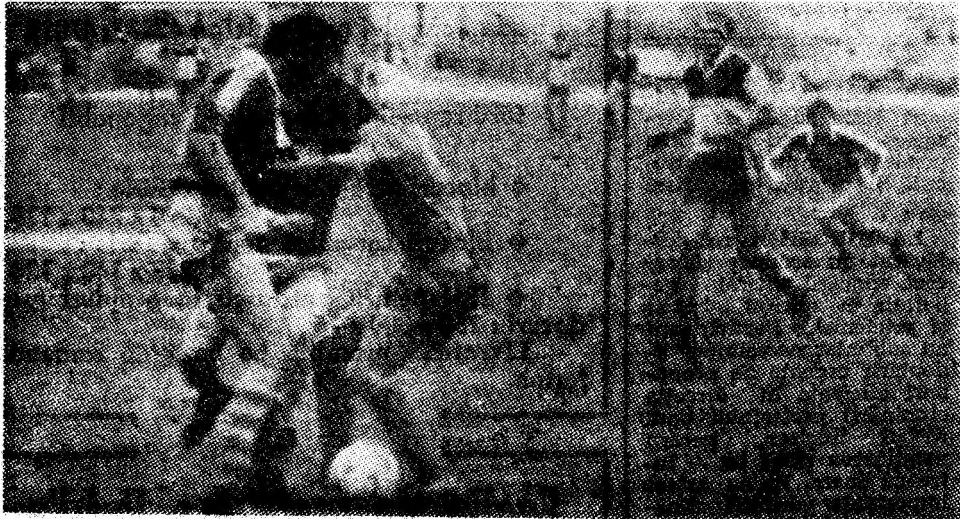
Fază din întîlnirea de duminică. Printre jucători, Vancea — un permanent pericol pentru poarta adversă.