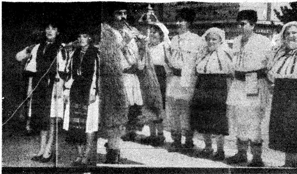
Cîntecul și portul popular specifice zonei noastre folclorice — iată ceea ce dorim să vedem și să auzim în ziua de 15 iunie, la prima ediție a festivalului de folclor momirlănesc.

Expoziția se constituie ca unul din momentele culturale deosebite înscrise sub genericul Lunii manifestărilor politico-ideologice, cultural-educative și sportive „Laudă omului muncii și creației sale” și este dedicată aniversării a 50 de ani de la procesul militanților comuniști și antifasciști de la Brașov. (H.D.)