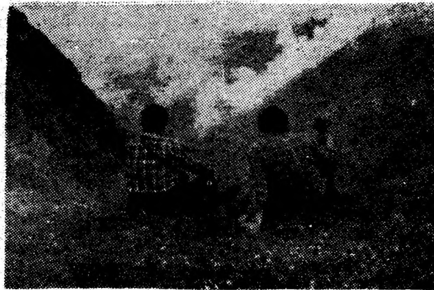
Popas în Retezat.