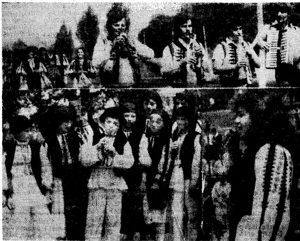
Imagini de la „Nedeia Tulipanului”.