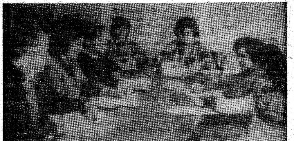
Dialog de lucru la întreprinderea de confecții Vulcan. Se discută lansarea în fabricație a noilor modele de confecții destinate exportului.