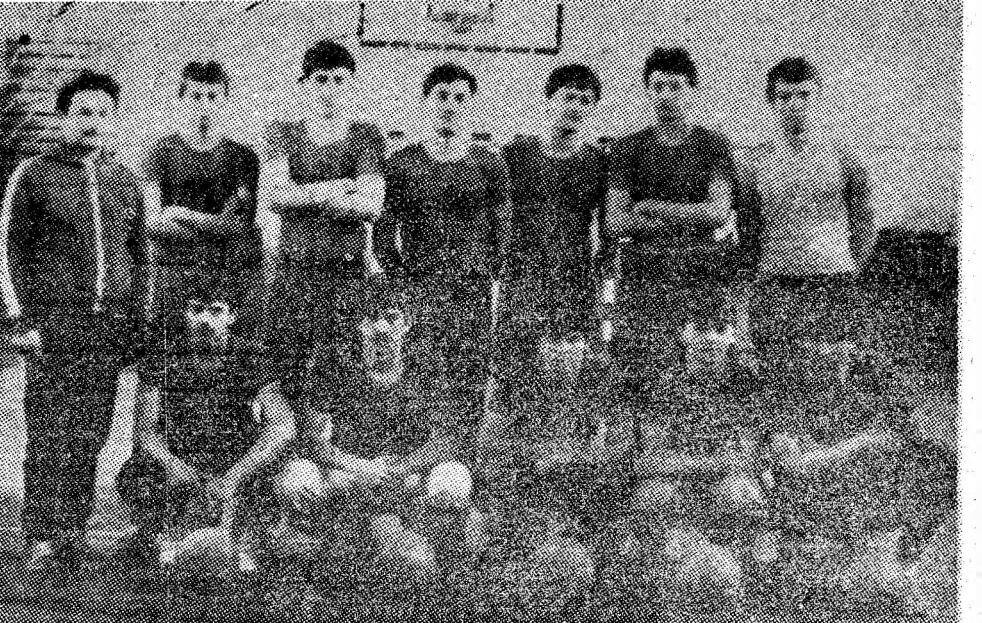
Echipa de volei de la Liceul industrial Petroșani, campioană pe ramura minieră.

Liceul industrial minier din Petroșani constituie o valoroasă pepinieră de talente și pentru discipline sportive cu prezență în prima divizie — lupte libere (Jiul Petrița, C.S.S.