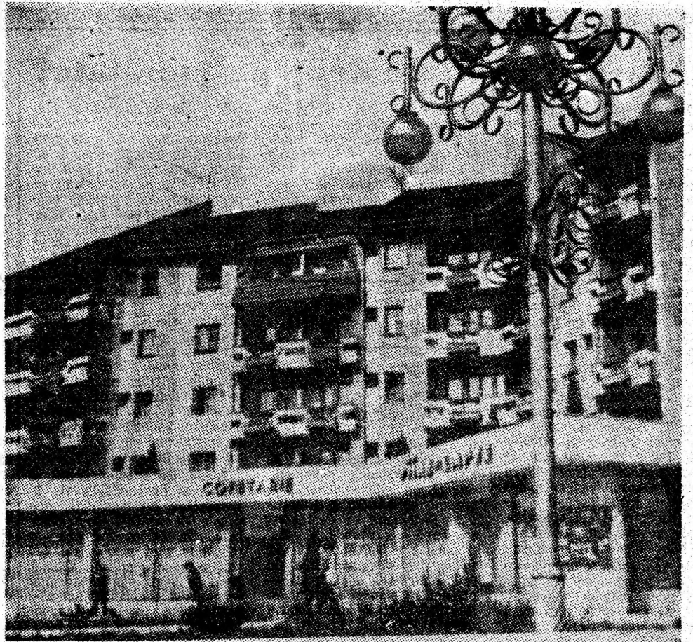
Secvență citadină din cartierul Petroșani-Nord.