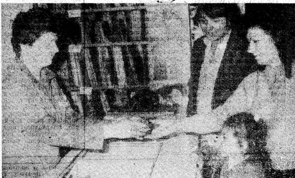
Unitatea Foto-Muzica, unitate fruntașă a I.C.S. Mixtă Vulcan.