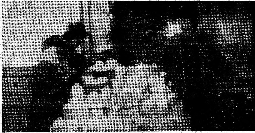
Secția de preparare a cuarțului de la Uricani. Aspect de muncă de la banda de sortare a substanței minerale utile.