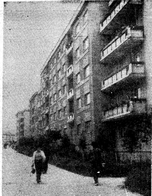
Construcții noi în orașul Lupeni.

În paralel, se lucrează la pregătirea noilor capacități de producție, pentru menținerea liniei de front la un nivel care să permită depășirea sarcinilor de plan. (S.B.)