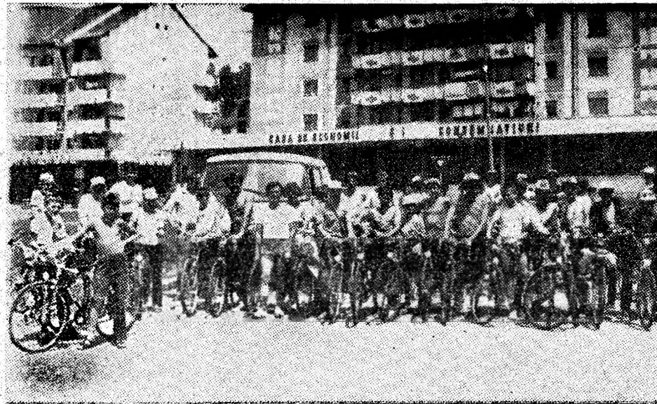
Scurt popas în Petroșani. Text și foto: Ovidiu PARAIANU

Miercuri, după orele amiezii, a poposit în municipiul nostru, expediția pionierească „Floarea prieteniei”, organizată de Consiliul Județean al pionierilor Covasna. Membrii expediției, pionieri în vîrstă de 11—15 ani și-au propus să străbată următorul traseu: Sf. Gheorghe — Odorhei — Sighișoara — Sibiu — Alba Iulia — Deva — Hunedoara — Petroșani — Tg. Jiu — Rm. Vilcea — Sf. Gheorghe, avînd obiectiv cunoașterea frumuseților patriei, a mărețelor înfăptuiri ale grandioasei epoci „Epoca Nicolae Ceaușescu”.