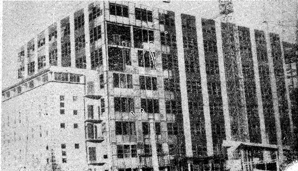
Doă imagini cu semnificații economice și sociale ale acestor ani — Spitalul municipal cu policlinică și noua preparație a cărbunelui din Uricani, în prag de punere în funcțiune.