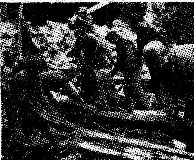
Uteciștii din Aninoasa la recuperarea unor materiale de construcții din vechiul atelier demolat.