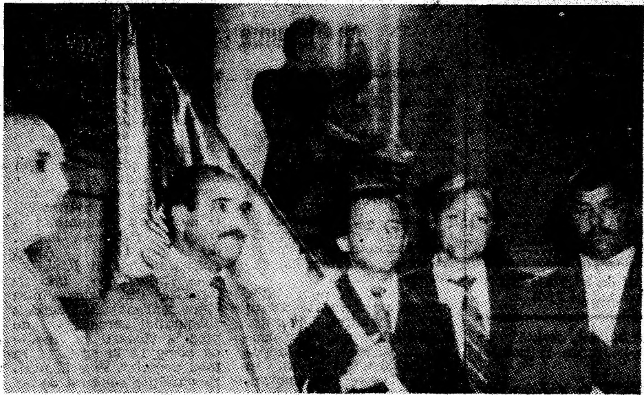
Aspect din timpul festivității de la Vulcan.