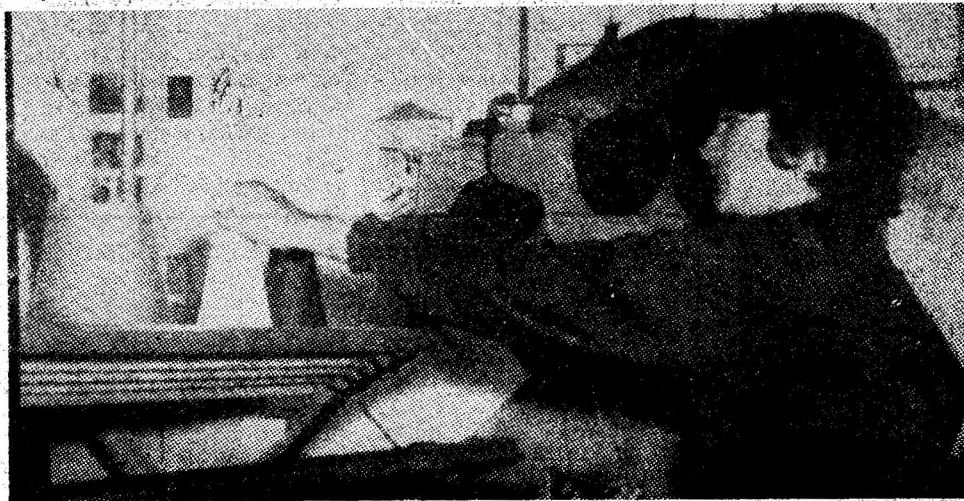
Imagine de muncă din atelierul de creație al întreprinderii de tricotaje din Petroșani.