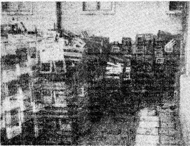
FOTO CRITICA PE ADRESA DELĂSĂRII