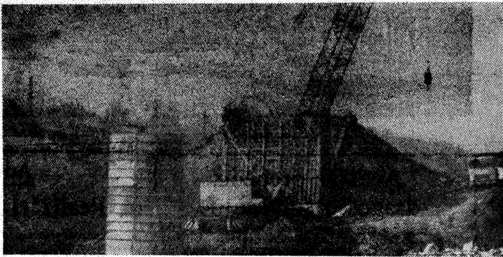
Ample lucrări pe șantierul viitoarei căi ferate Lupeni — Uricani.