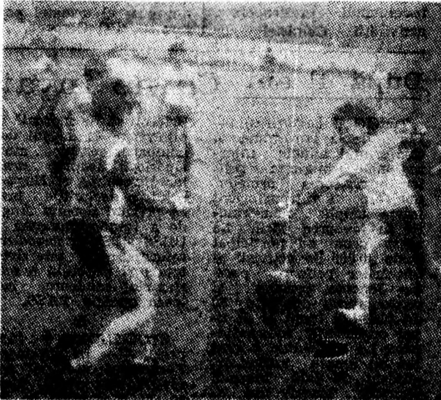
Aspect de la una din preselecțiile pentru pepiciera „Jiului”.