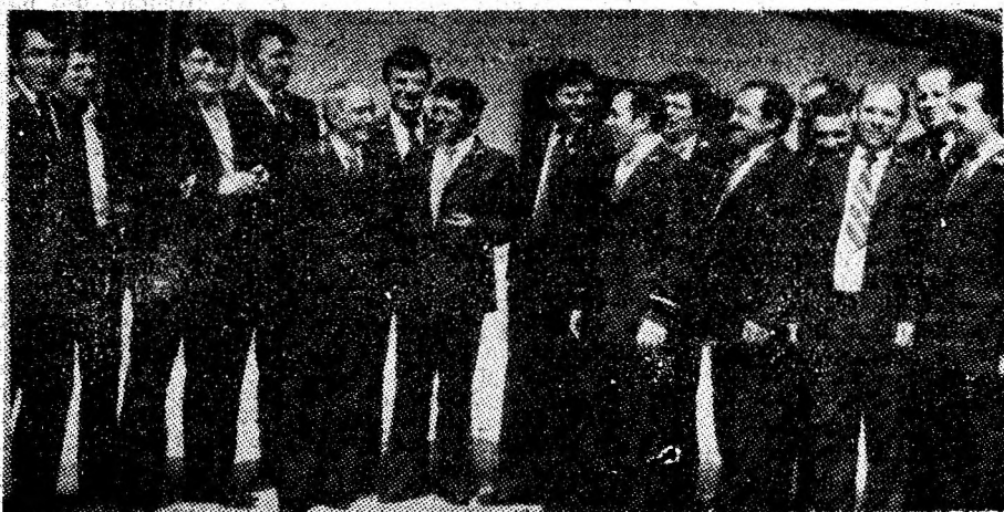
Secvență din momentele sărbătorești la locul de agrement „La Brazi” din Vulcan: ca într-o mare familie minerească, ortaci din localitate în dialog cu colegi de-ai lor de la Livezeni.