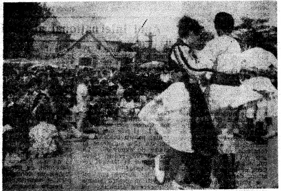
Din nou, cîntecul, jocul, voia bună au fost prezente, de Ziua minerului, la toate locurile de agrement din municipiul nostru.

Și asemenea celor prezenți la punctul de agrement „Brădet” din Petroșani — dintre care mai amintim colectivele unităților de alimentație publică „Parîngul”, „Cerna”, „Central”, „Bulevard”, „Carul cu bere”, „Cantina-restaurant” și cofetăria „Hermes” — și-au desfășurat activitatea toți lucrătorii comerciali care au participat prin punctele de desfășurare organizate la locurile unde s-a sărbătorit Ziua minerului. (Tudor MUNTEANU)