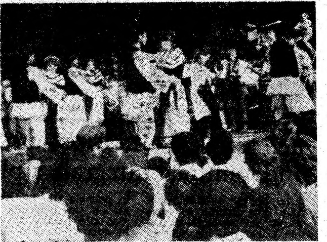
Imagini întîlnite, duminică, la toate locurile de agrement din Valea Jiului.

minei Vulcan și avem convingerea că vor constitui punctul de plecare al unor acțiuni energice pentru îmbunătățirea activității de protecție a muncii omului și zăcămintului, condiție esențială pentru îndeplinirea integrală, ritmică a sarcinilor de plan, pentru recuperarea minusului acumulat în primul semestru al anului, pentru a da țării, economiei noastre socialiste tot mai mult cărbune și de tot mai bună calitate. În fond, acesta este țelul nostru, unicul nostru țel al celor care ne desfășurăm activitatea în domeniul extracției de cărbune — fie eă lucrăm în activitatea de protecție a muncii, fie direct în procesul de producție — să dăm cărbune mai mult, dar în condiții de deplină siguranță a muncii.