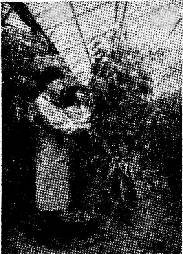
La serele I.A.C.C.V.J. din Lupeni, se recoltează legume pentru cantinele miniere.