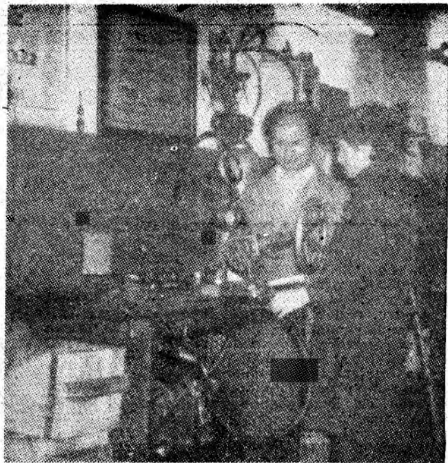
Aspect de muncă din atelierele S.S.H. Vulcan.

— Concret, pe structuri de meserii, care e situația?