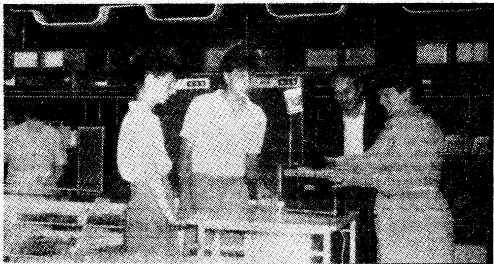
Magazinul universal „Jiul” — raionul „aparate electrice”.