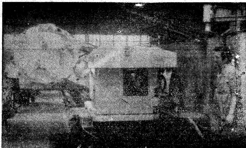
Atelierul de montaj combine — I.U.M.P.