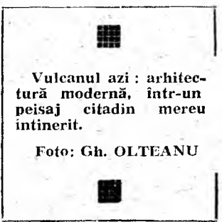
Vulcanul azi: arhitectură modernă, într-un peisaj citadin mereu întinerit.