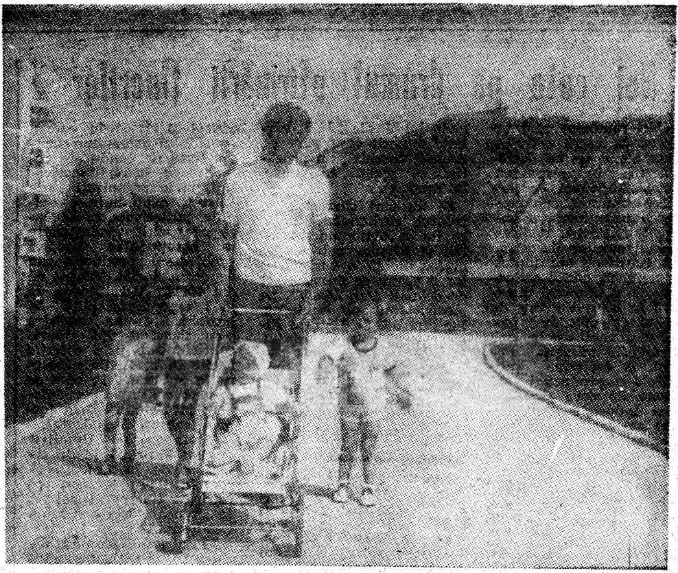
Instantaneu de duminică.

ANUL VIII, NR. 10 563 | DUMINICĂ, 31 AUGUST 1986 | 4 PAGINI — 50 BANI