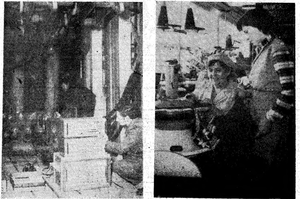
Imagini din două mari colective muncitorești: I.U.M.P. și Întreprinderea de tricotație.

Aici, la Paroșeni, detașamentul muncitoresc al tineretului cucerește cu fiecare zi, noi cote pe drumul afirmării plene, multilaterale (Al. H.)