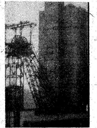
Nou și vechi în extracția pe verticală.

că, uzina constructorilor de utilaje miniere, vor reuși să-și onoreze toate sarcinile economice și sociale, realizînd principalul deziderat al propriei meniri: sporirea aportului la mecanizarea proceselor tehnologice în unitățile miniere din Valea Jiului și din țară. Vom răspunde astfel încrederii pe care conducerea partidului ne-a acordat-o nominalizînd unitatea noastră ca întreprindere reprezentativă în domeniul construcțiilor de mașini, utilaje și instalații pentru industria minieră.