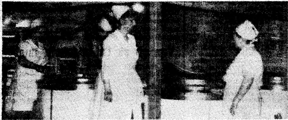
Cantinele miniere (în imagine cea de la Paroseni, a IACCVJ), beneficiarele condițiilor de bună aprovizionare pentru iarnă.