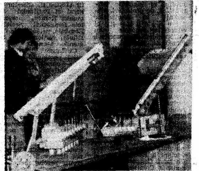
La planșetă. Prind contur proiectele unor noi lucrări pentru dezvoltarea capacităților de producție.

SOFIA 4 (Agerpres). — La Plevna s-a disputat meciul internațional de fotbal dintre echipa reprezentativă a Bulgariei și lotul olimpic al României. Partida s-a încheiat cu scorul de 3-2 (2-0) în favoarea gazdelor. Golurile formației române au fost înscrise de Vaișcovici și Rada. Pentru selecționata bulgară au marcat Kolev, Alexandrov și Sirakov.