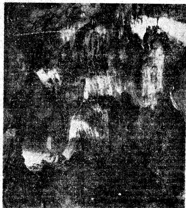
Imagine ce dorim s-o păstrăm nealterată, s-o transmitem generațiilor viitoare.