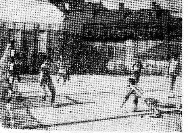
Aspect din timpul desfășurării competiției de handbal, găzduită de terenul Școlii sportive Petroșani.

La buna organizare și desfășurare a întrecerilor, un sprijin deosebit l-au adus colegiile municipale de arbitrii (handbal și volei). (S. BALOI)