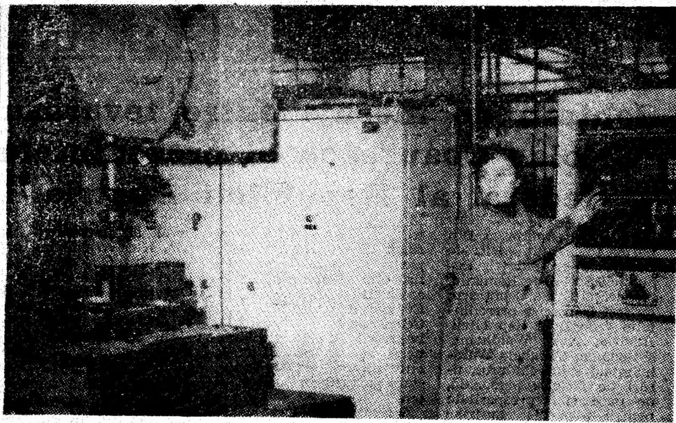
I.U.M. Petroșani. Automatizarea — un proces complex în continuă extindere în această citadelă a construcțiilor de mașini miniere.

De curînd, la parterul blocului 92 de pe strada Republicii s-a deschis o nouă unitate a cooperativei „Unirea” din Petroșani. Este vorba despre unitatea nr. 88 Tapițerie, care este o noutate în materie de prestări servicii, intrucît în ultimii 15 ani, cooperativa nu a prestat astfel de lucrări. După cum sînt informați, unitatea execută reparații la fotolii, recamiere, scaune, canapele, studiouri. De asemenea, se schimbă arcuri și stufe, cu materialul clientului sau al cooperativei, precum și lucrări de capitonări la uși și birouri, pentru populație, dar și pentru întreprinderi și instituții. (B. Mircescu)