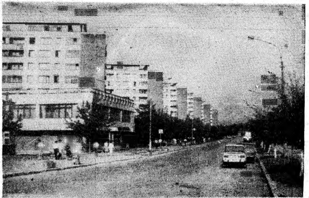
Tot ce oferă frumos, orașul Vulcan.