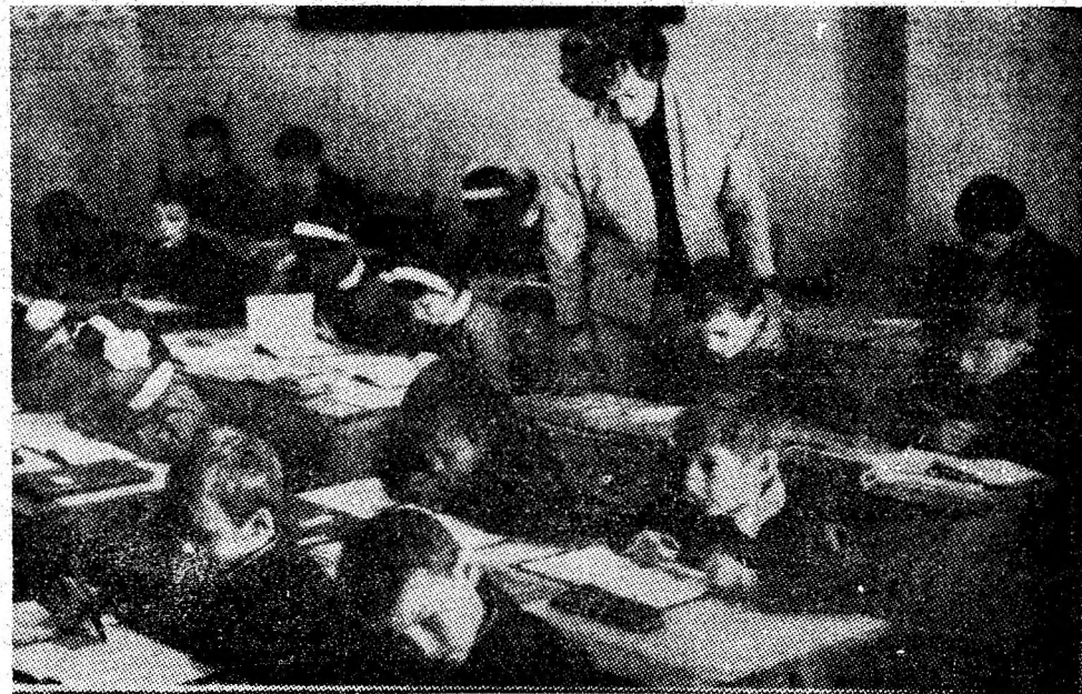
La început de an școlar