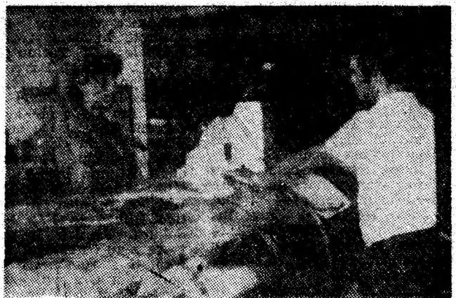
Magazinul universal „Jiul” — raionul „galanterie bărbăți”.