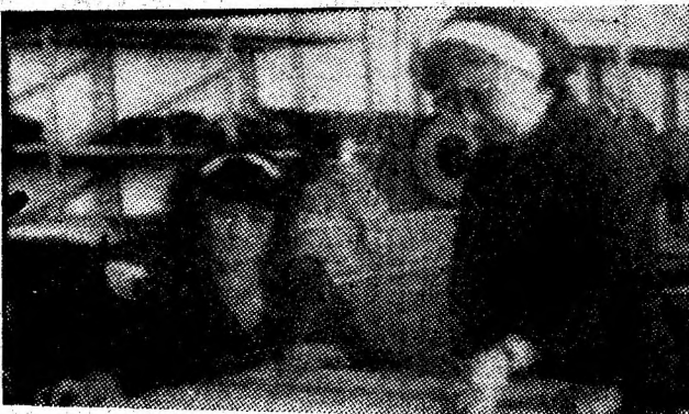
Imagine din sala de croit a Întreprinderii de confecții 'Vulcan'.

Mircea cel Mare a adus parte din ciclul de acțiuni politico-educative dedicate sărbătoririi a 600 de ani de la urcarea pe tron a Marelui Mircea Voievod, moment de excepțională importanță pentru istoria românilor. Vor fi evidențiate, în luările de cuvînt, evenimentele de seamă ale istoriei naționale, precum și împlinirile din viața oamenilor României socialiste în acești ani pe care, cu vie mîndrie patriotică îi numim „Epoca Nicolae Ceaușescu”. (A.H.)