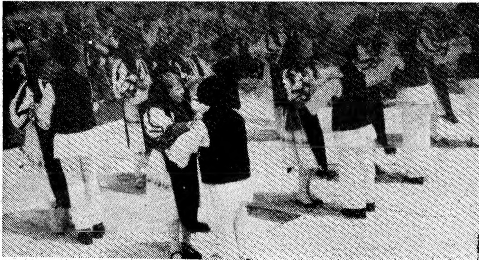
Alături de artiștii amatori, pionierii se află și ei în febra pregătirilor pentru etapele superioare de concurs ale ediției a VI-a a Festivalului național „Cîntarea României”. În imagine, un colectiv artistic pionieresc cu frumoase rezultate în competițiile artistice școlare, formația de dansuri a Școlii generale nr. 2 Petrița, într-un spectacol în aer liber, susținut în etapa de masă a festivalului.

Fiecare acțiune s-a constituit ca un vibrant omagiu adus luptei înaintașilor pentru dreptate și libertate națională, precum și muncii rodnică a națiunii, sub conducerea înțeleaptă a comuniștilor, pentru edificarea societății socialiste multilaterald-zvoltate.