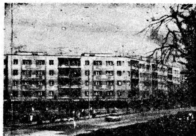
Vulcanul, în continuă innoire arhitectonică.