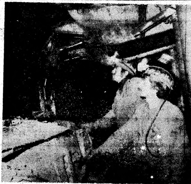
Mecanizarea complexă, prezență cotidiană în abatajele Văii Jiului.