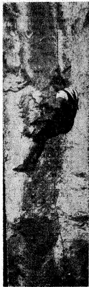
Sfîdînd înălțimile.