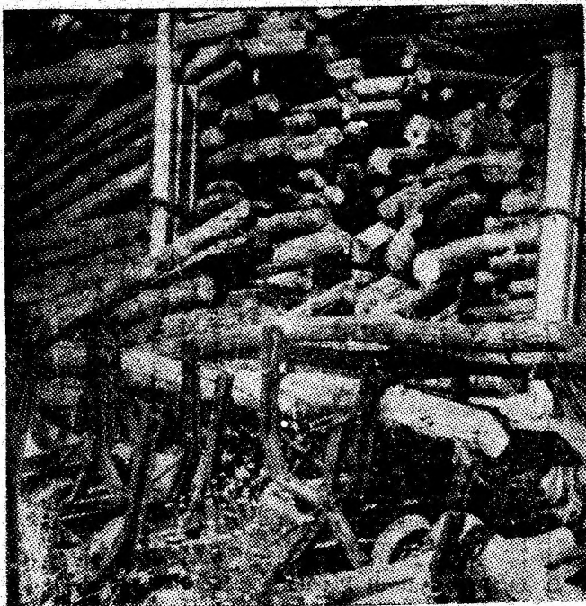
În depozitul de lemne, „zac” și aceste cărucioare de mină.

Cu spirit critic, din dorința de a îndrepta ceea ce trebuie îndreptat, cu aparatul de fotografiat, martor obiectiv la „pozitiv” și „negativ” dorim să vedem și să prezentăm cititorilor noștri modul cum se desfășoară pregătirile de iarnă, acum cînd, în timpinarea ei, număratoarea inversă a început. Prima vizită la I.M. Bărbăteni. Dacă în incinta principală a minei sînt ceva semne că acțiunea s-a declanșat, jos, în incinta auxiliară, situată lîngă gara Bărbăteni, imaginea este aceeași de acum 9 luni, 6 luni, 3 luni... Adică a unei dezordini totale. Dar, iată, imaginile, credem noi, suficient de grăitoare: