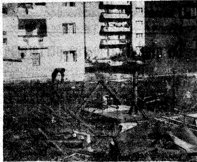
În imediata vecinătate a blocurilor de locuințe de pe bulevardul Păcii acest (prezent) morman de fier (nou) tinde să devină un viitor morman de fier vechi.