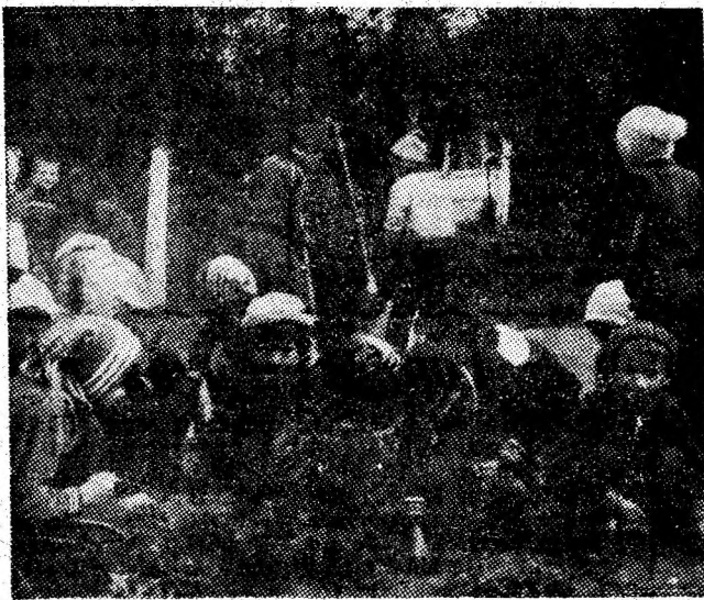
VULCAN. Elevii — prezentă activă la acțiunile de curățenie.

Concluziile care se impun sînt evidente. Lucrările de construcții și montaje se cer mai bine coordonate la nivelul antreprenorului general și al beneficiarului. Se impun, de asemenea, demersuri ferme pentru urgentarea livrării de utilaje, însoțite de cele de care depinde direct începerea probelor tehnologice și pentru aprovizionarea cu uleiuri minerale necesare rodajelor utilajelor și instalației transformatoarelor. Se știe doar că fiecare zi, fiecare lună de întârziere a punerii în funcțiune a oricărei lucrări de investiții însemnează cheltuieli suplimentare, pierderi pentru economia națională!