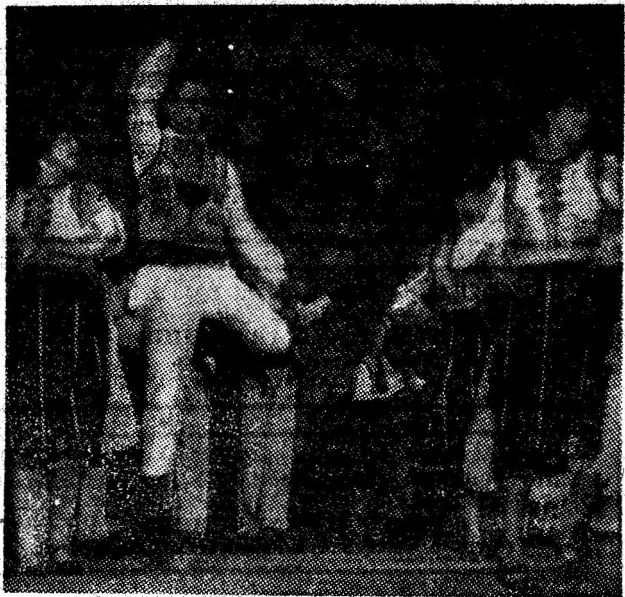
Ansambllul folcloric „Paringul”, al Casei de cultură a sindicatelor din Petroșani, este unul dintre colectivele artistice prestigioase ale Văii Jiului. Fiecare prezență a sa pe scenele așezămintelor de cultură din Valea Jiului, la locurile de agrement, în sălile de apel este viu aplaudată de marele public. În noua ediție a Festivalului național „Cîntarea României”, ansambllul se va situa, fără îndoială, printre protagoniste.