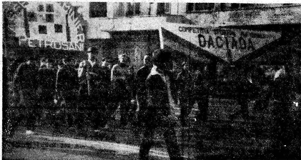
Aspect de la deschiderea anului de pregătire a tineretului pentru apărarea patriei, sport și turism.