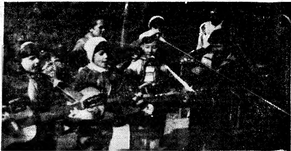
La „Brădet”, cîntecul și veselia au dat farmec unei minunate zile de toamnă aurie.

În ansamblu, „De treci codrii de aramă” — ediția a XVII-a, a însemnat un veritabil succes, un festival al hărniciei și îndemnării pionierilor, o vibrație manifestare a înaltelor disponibilități creatoare ale purtătorilor cravatei roșii cu tricolor. Platoul „Brădet” a cunoscut duminică îngemănarea soarelui de toamnă și a copilăriei fericite într-o fermecătoare „odă a bucuriei”.