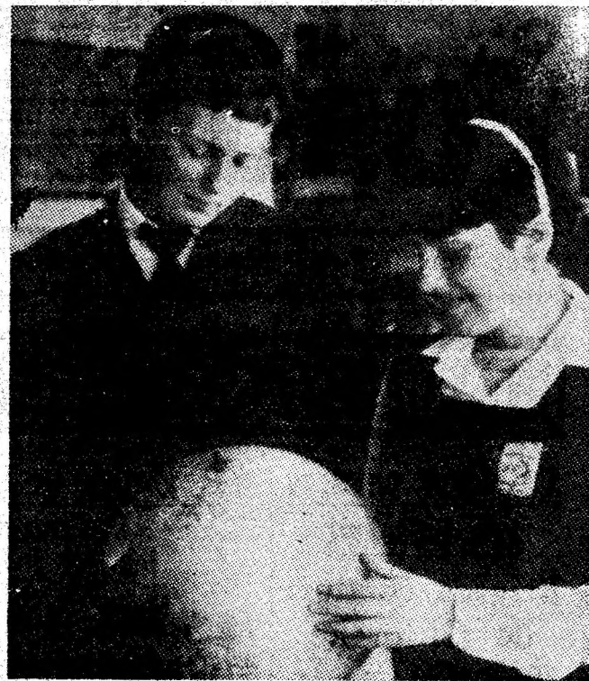
Oră de geografie, la Liceul industrial minier din Vulcan.

„Deosebit de interesante și utile aceste filme — ne-a spus tehnicianul Ștefan Lungu. Întreprinderea cinematografică a introdus în practica muncii prezentarea de filme în sălile de apel. Noi vedem în aceasta, o modalitate de acțiune pentru lărgirea orizontului de pregătire