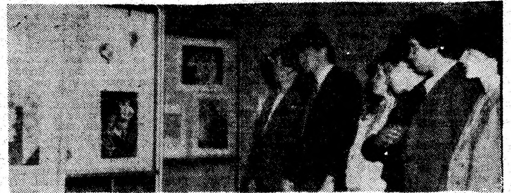
Aspect dintr-una din expozițiile găzduite de foaierul Casei de cultură a sindicatelor.