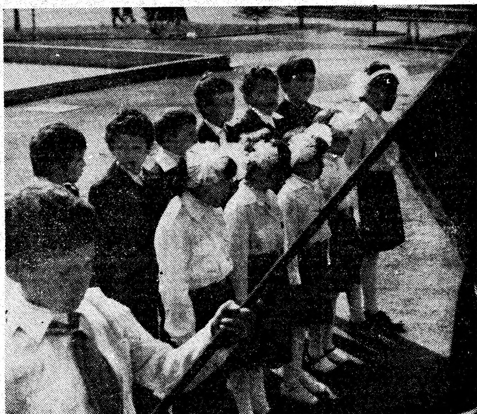
Moment solemn, emoționant. În fața drapelului, pionieri din clasa a II-a, Școala generală nr. 1 Petrița.

Copiii de la Școala generală nr. 7 din Petroșani au fost primiți în rîndul pionierilor la monumentul „Lupeni '29”, iar cei de la Școala generală nr. 6 Petrița la Sarmizegetusa și la Muzeul mineritului.