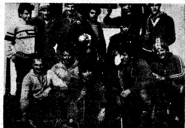
Autorii reușitei speologice de la Răchiteaua.