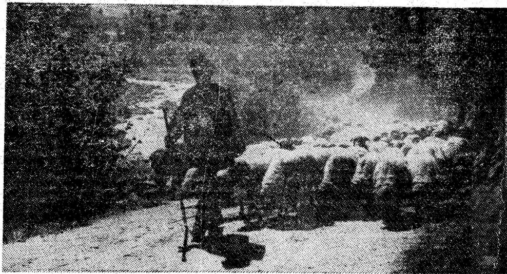
„Tună” oile din munte.

Succesiunea pe verticală a celor 24 strate de cărbuni humici ne arată, în același timp, numărul mișcărilor oscilatorii și caracterul lor sacadat care, în final, a determinat variații în ceea ce pri-