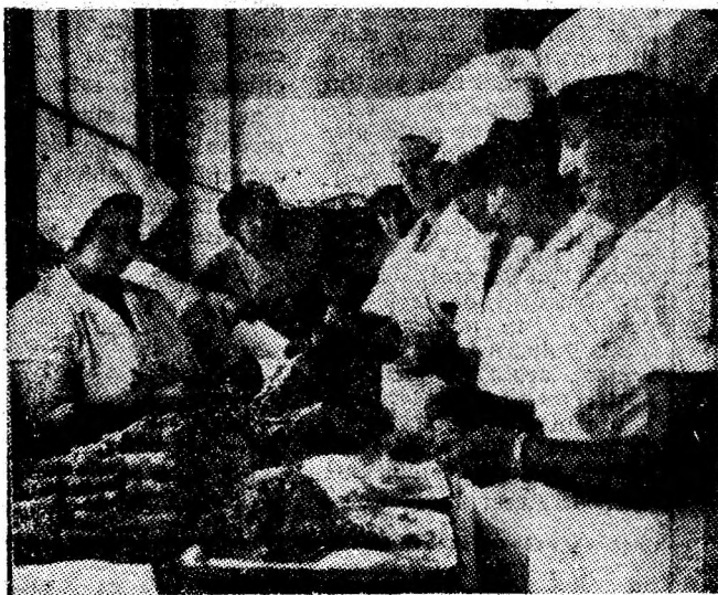
O unitate fruntașă a I.A.C.C.V.J. — cantina minerilor din Petrița.

De o săptămîină, copilul Pal Florin nu s-a mai întors acasă. Este elev în clasa a II-a la Școala generală nr. 6 din Petroșani și locuiește în Petroșani pe strada Aviatorilor, în blocul 12, scara III, apartamentul 3. În ziua cînd a plecat pentru a se juca era îmbrăcat în pantaloni maro, bluză verde, haină de la uniformă școlară, cismuțe din cauciuc. Este micuț, brunet și cu părul scurt. Cine îl întîlnește ori poate să dea relații despre el este rugat să anunțe organele de miliție sau familia.