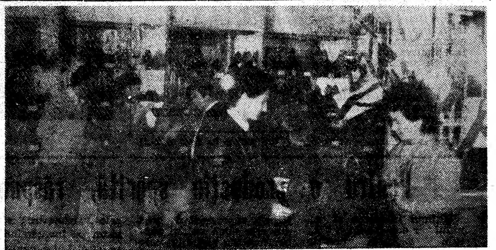
Solicitudine, servire operativă în unitățile comerciale. Imagine din unitatea „Adam” a ICSMI Petroșani.

minei și cele auxiliare. Referitor la planul ce revine I.M. Cîmpu lui Neag în cel de-al doilea an al cincinalului, pot să spun că el este deosebit de mobilizator. Cifrele de plan sînt pe deplin realizabile. Ele sînt pe măsura capacității colectivului nostru, a dotării sale și judicios defalcate pe întreaga perioadă a anului 1987. Sintem ferm convinși că, încă din prima lună a anului, ne vom realiza sarcinile de plan. Pentru aceasta solicităm sprijin conducerilor CMVJ și IPCVJ în vederea asigurării ritmice cu vagoane în structura prevăzută în preliminarile lunare și trimestriale. Accentuăm: aceasta deoarece de modul în care primim vagoane depinde livrarea cărbunelui atît din cariera centrală cît și a celui din micracarierile Balomir și Uricani-Sud spre ceilalți beneficiari din țară.