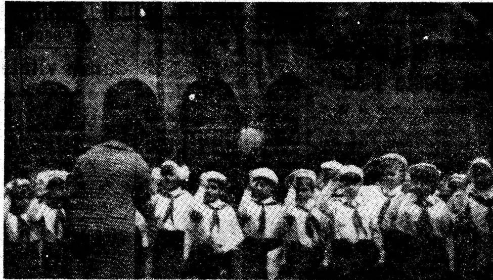
Aspect din timpul înmînării cravatei roșii cu tricolor.