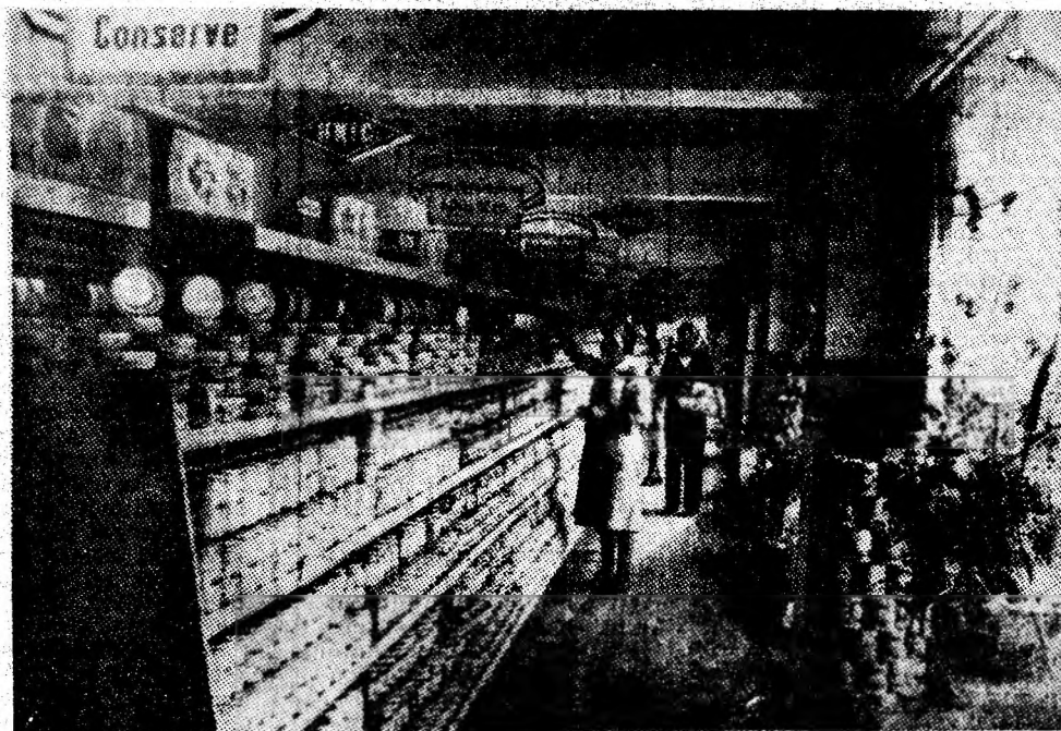
Magazinul alimentar „UNIC” din Vulcan.

• De la începutul lunii octombrie până ieri, din abatajele întreprinderilor miniere Paroșeni, Lonea, Cîmpu lui Neag și Valea de Brazi au fost livrate 47 425 tone de cărbune peste sarcinile de plan. (V.S.)