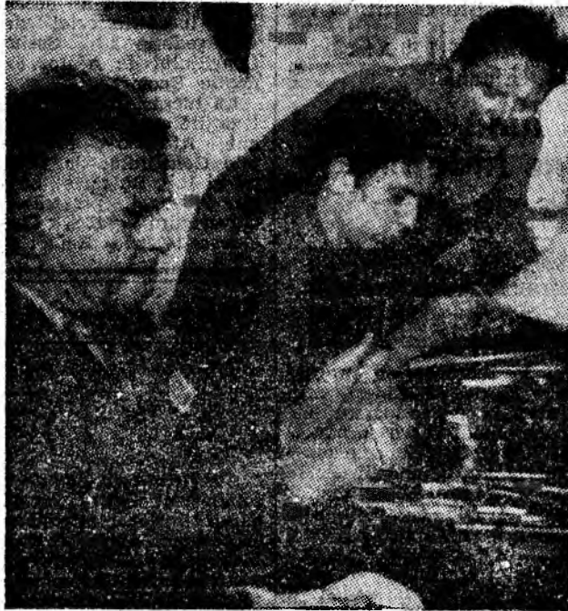
Secția metrologie a IPSRUEEM Petroșani — locul unde își spun cuvîntul înaltul profesionalism, competența în a face lucru de precizie.