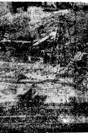
Securi, tamburi, suporturi de bandă, alte piese metalice, într-o dezordine evidentă.