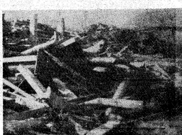
...așa cum o demonstrează și această imagine, realizată în depozitul de lemne.