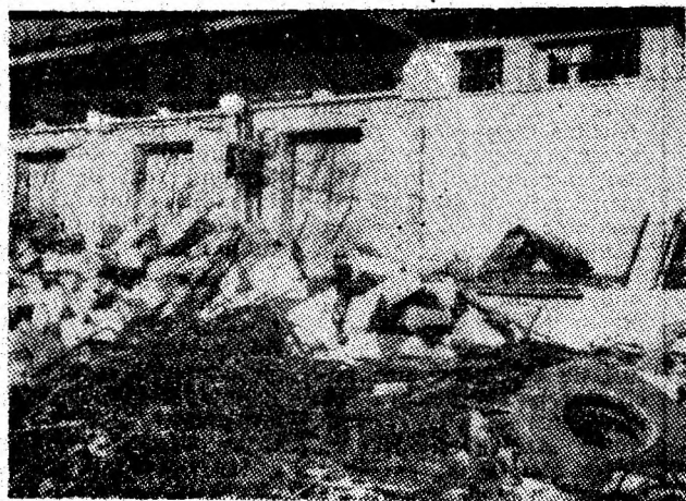
Un aspect dezolant, chiar în fața magaziei de materiale: cabluri, anvelope uzate, fier vechi și... boltări noi!