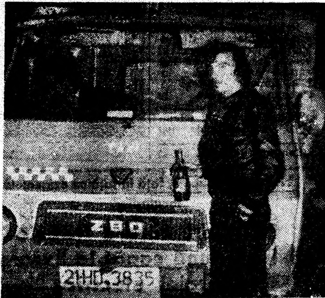
Autofurgoneta din imagine — transformată ad-hoc în... minibar.

Concluziile care se impun sînt evidente. Între constructorii, instalatorii și CDEE trebuie să existe o mai strînsă conlucrare în finalizarea lucrărilor. Dar ceea ce se impune îndeosebi, este ca la nivelul comisiilor de recepție, noile apartamente să nu fie admise sub nici un motiv fără a avea executate toate utilitățile prevăzute în proiecte. Decît apartamentele fără utilități, mai bine apartamente date în folosință mai tîrziu, dar executate fără nici un reproș. Oricum, întîrzierilor în livrarea energiei electrice în noile apartamente date în folosință trebuie să li se pună capăt cu toată fermitatea!