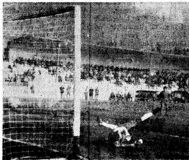
Șutul înșelător al lui Colceag, de la Minerul, îl învinge pentru întâia oară pe portarul timișorean.