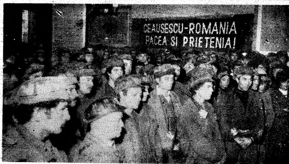
Adunarea pentru pace desfășurată la I.M. Paroșeni.