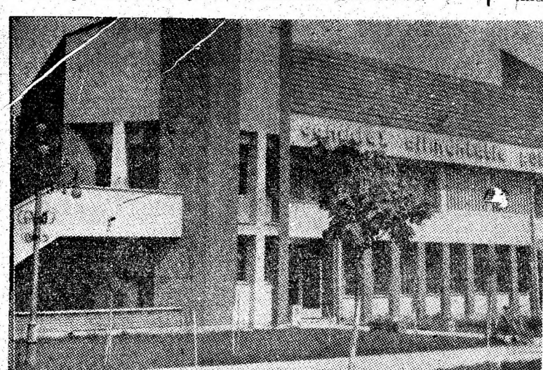
Doă imagini de referință privind profunde și calitative prefaceri petrecute în viața orașelor (stînga — Petroșani, dreapta — Vulcan), din Valea Jiului.