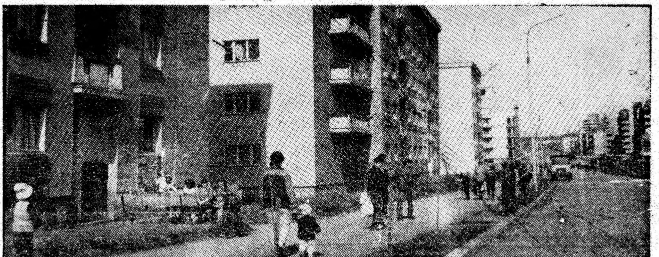
Rezultat al muncii constructive din acești ani ai socialismului, bogăți în împliniri, orașul minerilor — Lupeni, cunoaște a doua sa tinerețe.

O atenție deosebită se acordă calității confecțiilor, în acest scop fiind exercitat un exigent și competent control interfațic, pe întreg fluxul de fabricație. (C.T.D.)