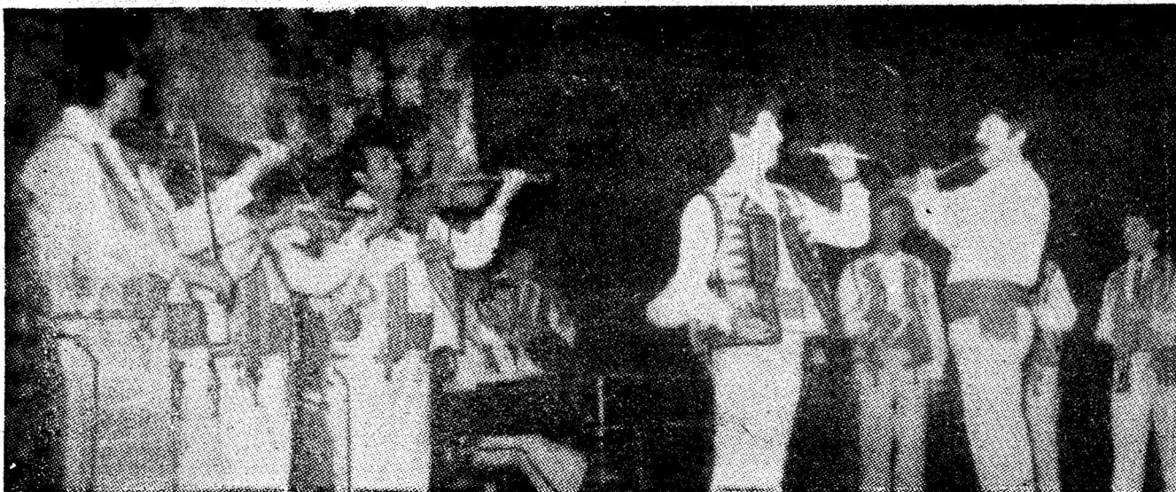
Ansamblul folcloric „Paringul” — o prezență permanentă pe scenele municipiului.