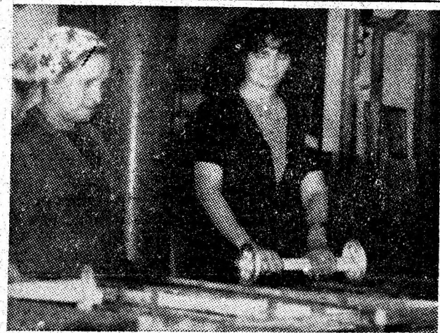
Echipa de acoperiri galvanice din Uzina de echipament hidraulic — Vulcan.

Într-o atmosferă însuflețitoare, de puternică angajare muncitorească pentru înfăptuirea politicii partidului, la încheierea festivităților a fost adresată o telegramă tovarășului Nicolae Ceaușescu, secretar general al Partidului Comunist Român, Minerul de Onoare al țării, în care, între altele, se spune: Mobilizați de sarcinile importante ce ne revin din documentele Congresului al XIII-lea al partidului, de înflăcăratele chemări și îndemnuri adresate întregii națiuni de către dumneavoastră, iubite conducător de partid și de stat, de la tribuna impresionantă adunări populare pentru pace și dezarmare din Capitala patriei, ne angajăm să ne înzecim eforturile în muncă, pentru amplificarea succeselor de pînă acum, pentru asigurarea țării cu cantități tot mai mari de cărbune și situarea în continuare a minei noastre pe locuri fruntașe în întrecerea socialistă. Vă asigurăm, mult stimat și iubite tovarășe Nicolae Ceaușescu din adîncul inimilor noastre calde de mineri, de întreaga dragoste și stimă cu care vă înconjurăm, de fierbintele nostru atașament și totala adeziune la politica partidului și statului, la strălucitele idei, inițiative și opțiuni de pace și dezarmare adresate de dumneavoastră țării noastre și lumii întregi încredințîndu-vă că le vom susține neabătut prin noi și tot mai însemnate fapte de muncă.