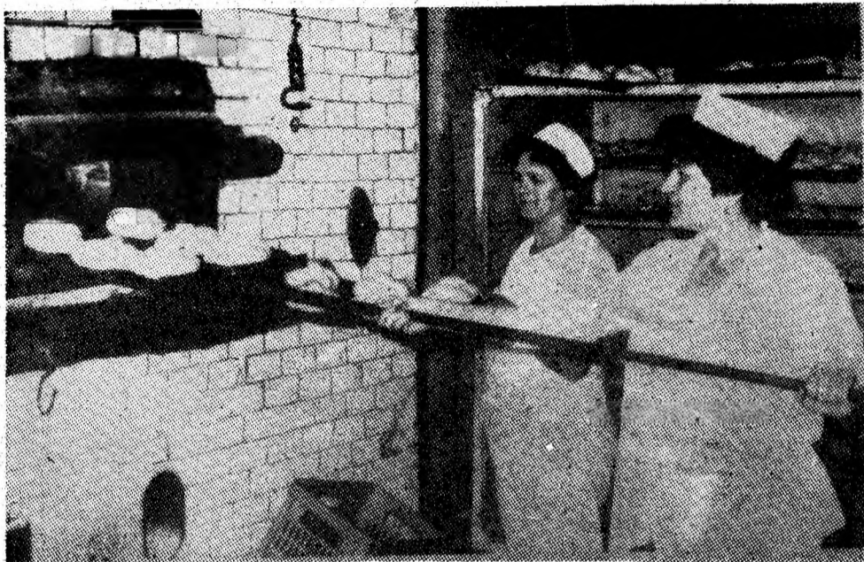
O nouă șarjă, la gura cuptorului.