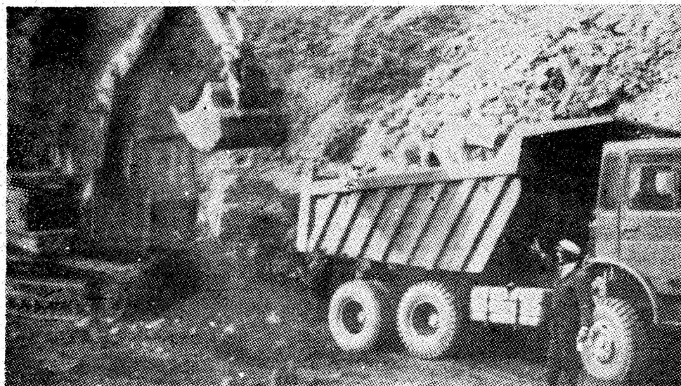
Timp prielnic în carieră.

Cursurile universității pentru anii II și IV se desfășoară luni, 8 decembrie a.c., ora 16, la cabinetul de partid.