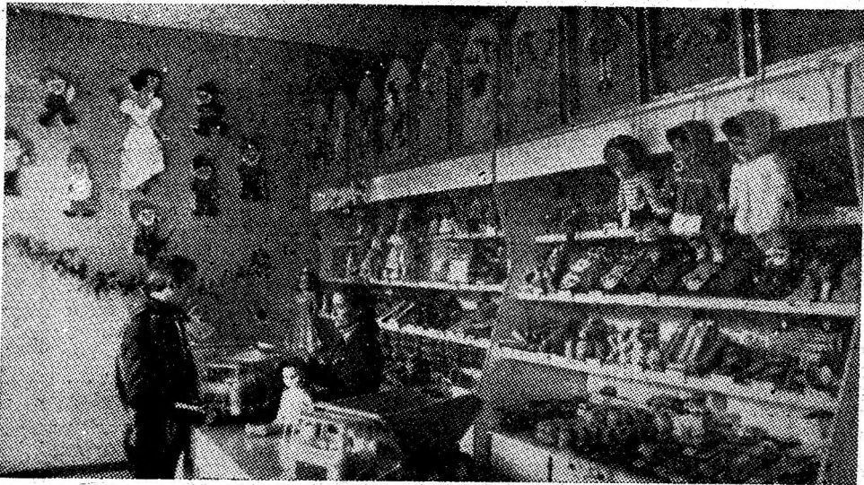
Comerțul vulcănean în „Luna cadourilor”.